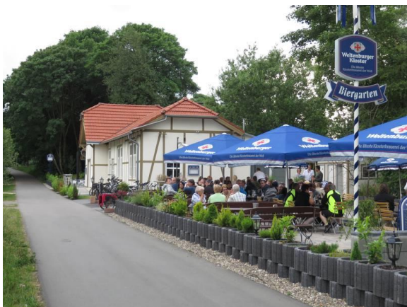
Alter Bahnhof Burscheid

Hier findet sich immer jemand, der gerne erklärt was wo und wann stattfindet.